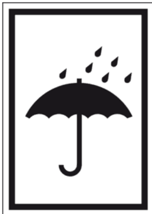
Vor Regen schützen

Die Folgenden Beschilderungen sind auf den Umverpackungen anzubringen, sofern dieses nötig ist. Hierzu zählen z.B. Kartons welche gegen Regen geschützt werden müssen, oder Verschlüge welche eine Stapelfähigkeit nicht zulassen.