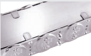
Stahlbandhalter an den Seitenbändern.

Stahlbandabdeckungen für die übrigen Typenreihen auf Anfrage!