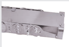
Befestigung am Kettenschluss mit speziellem Anschlusswinkel.