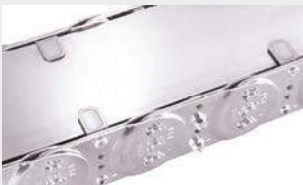
Stahlbandhalter an den Seitenbändern.

Stahlbandabdeckungen für die übrigen Typenreihen auf Anfrage!