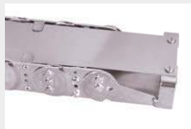
Befestigung am Kettenschluss mit speziellem Anschlusswinkel.