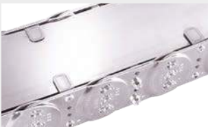
Stahlbandhalter an den Seitenbändern.

Stahlbandabdeckungen für die übrigen Typenreihen auf Anfrage!