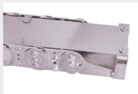
Befestigung am Kettenschluss mit speziellem Anschlusswinkel.